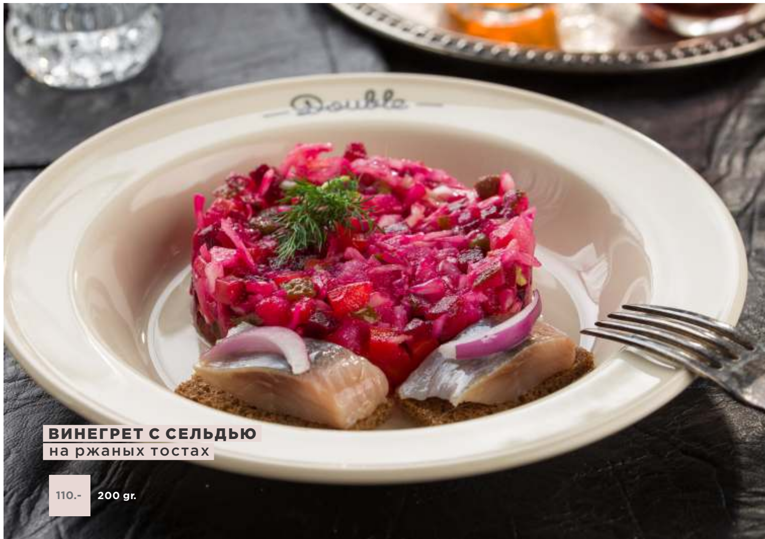
ВИНЕГРЕТ С СЕЛЬДЬЮ на ржаных тостах