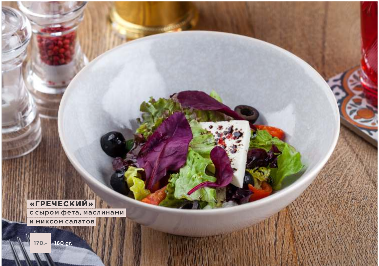
«ГРЕЧЕСКИЙ» с сыром фета, маслинами и миксом салатов