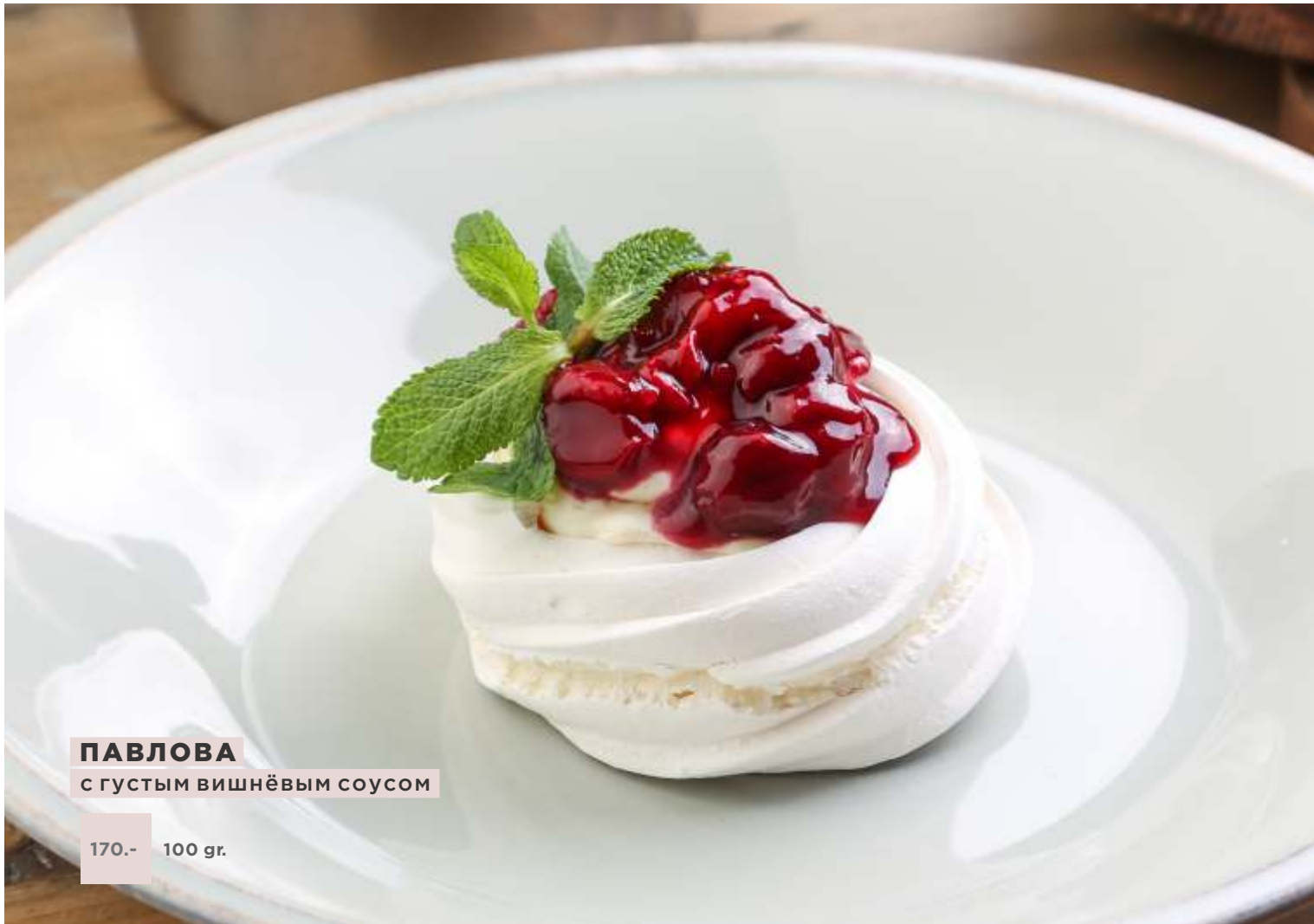
ПАВЛОВА с густым вишнёвым соусом