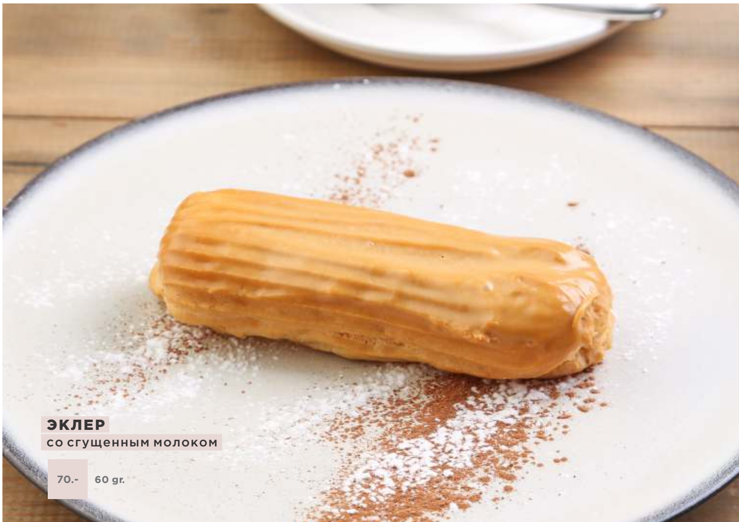
ЭКЛЕР со сгущенным молоком