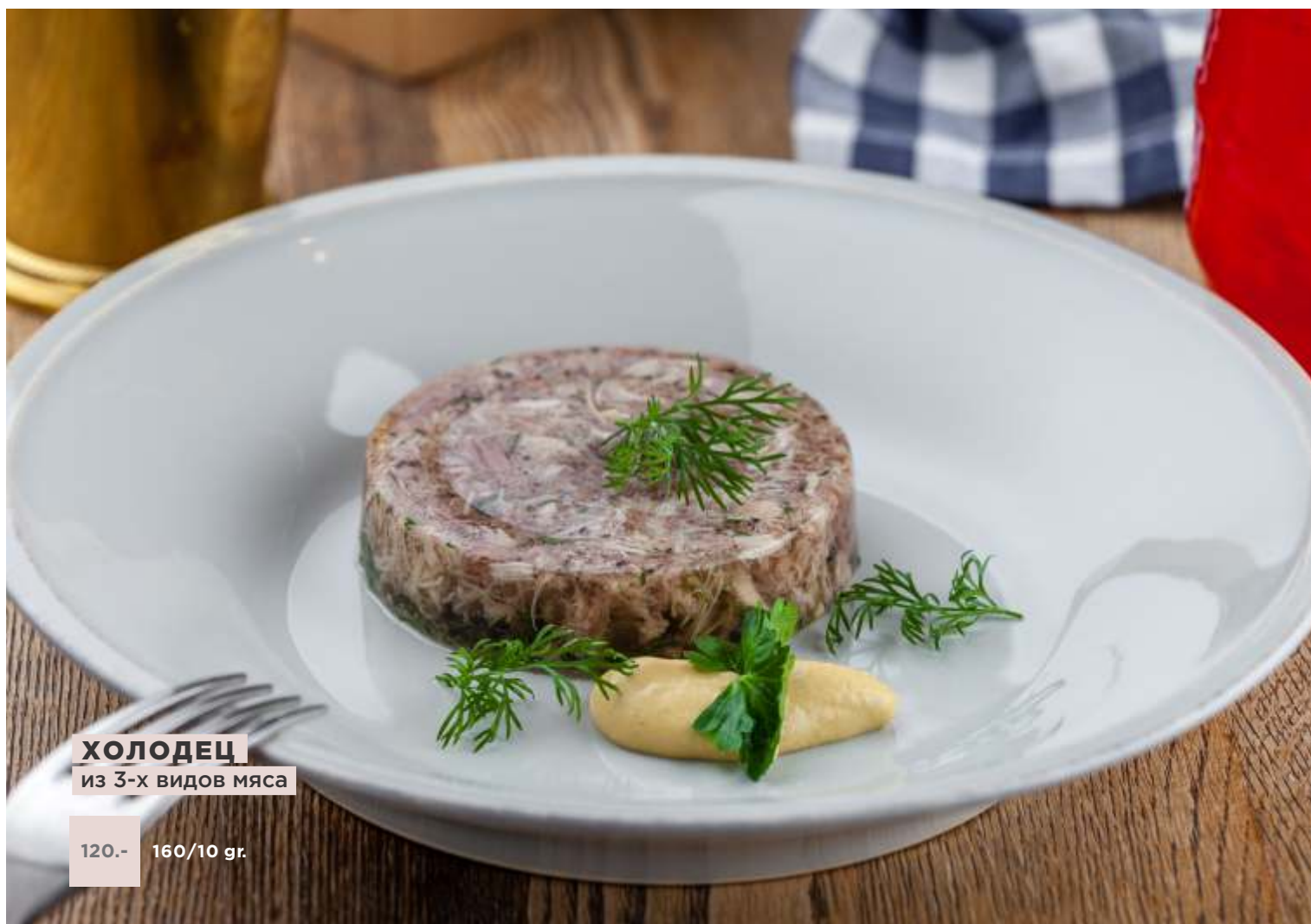
ХОЛОДЕЦ из 3-х видов мяса