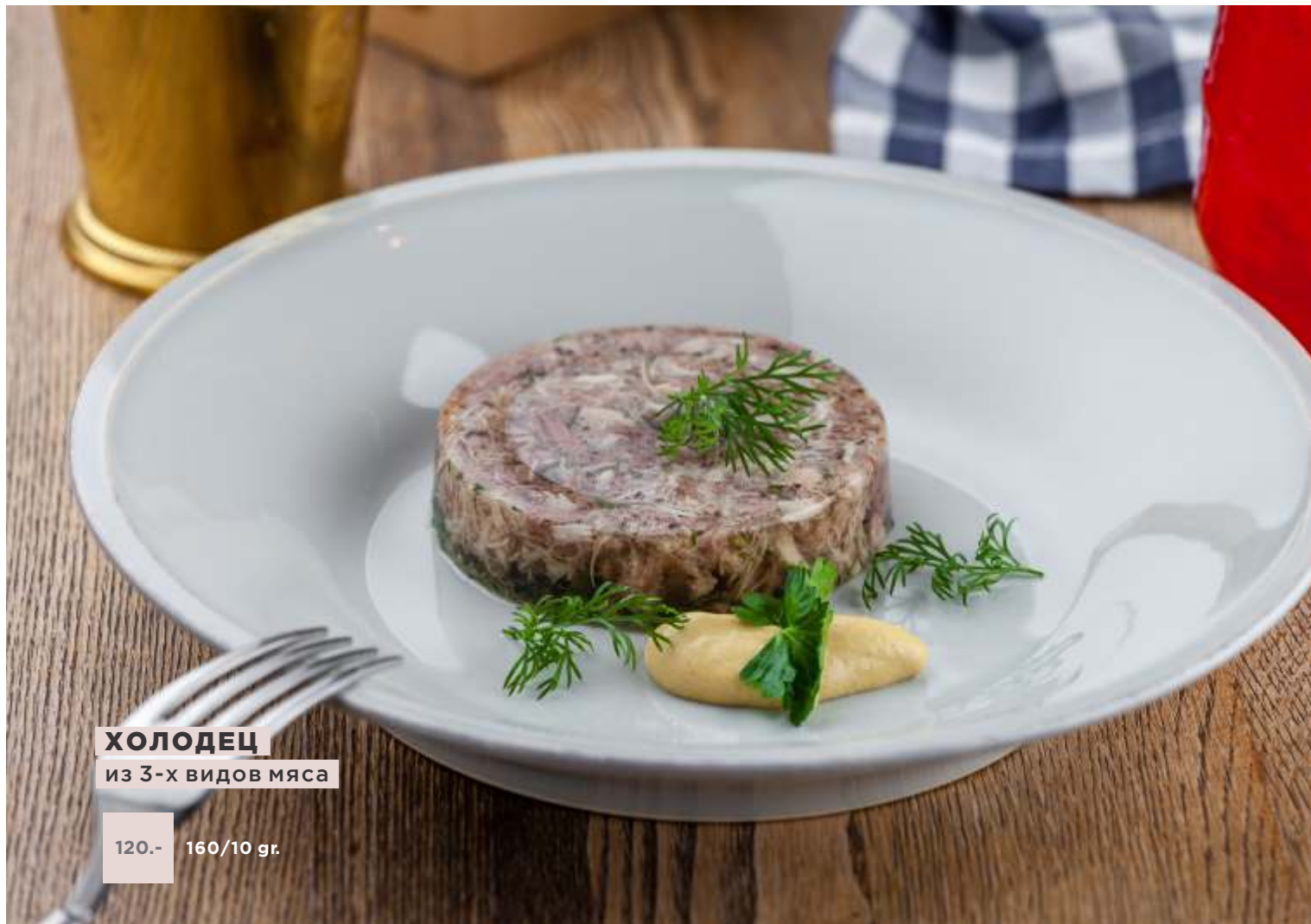
ХОЛОДЕЦ из 3-х видов мяса