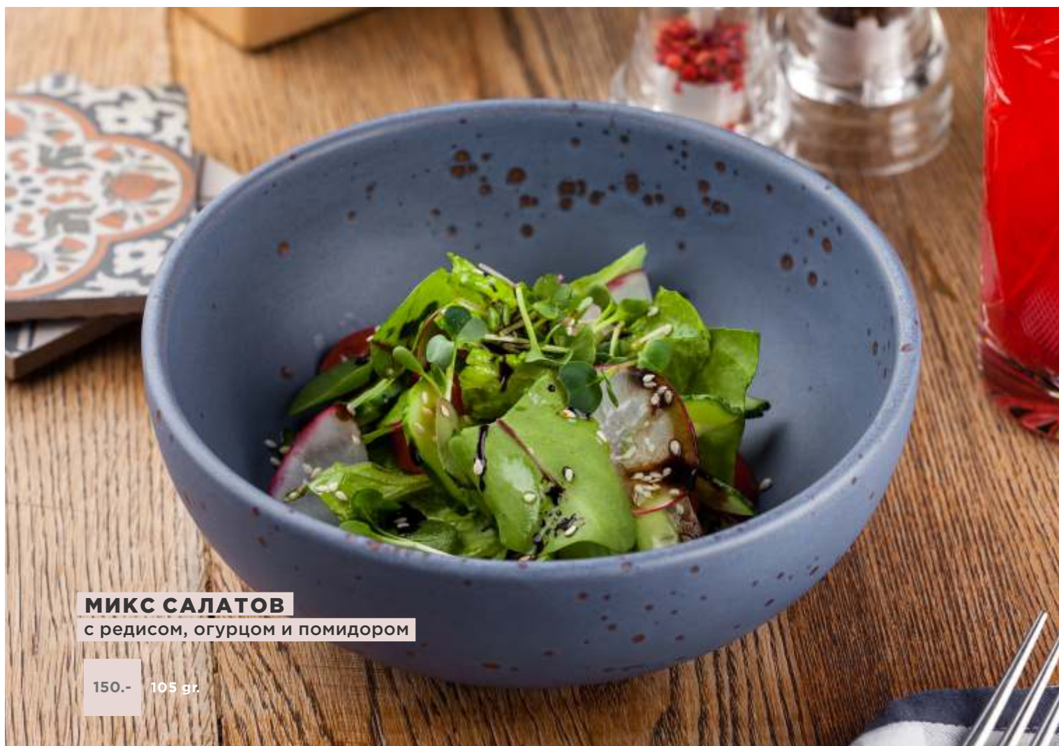
МИКС САЛАТОВ с редисом, огурцом и помидором