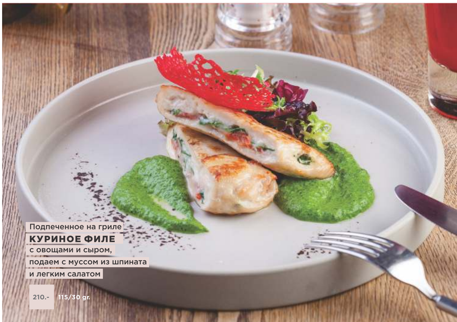
Подпеченное на гриле КУРИНОЕ ФИЛЕ с овощами и сыром, подаем с муссом из шпината и легким салатом