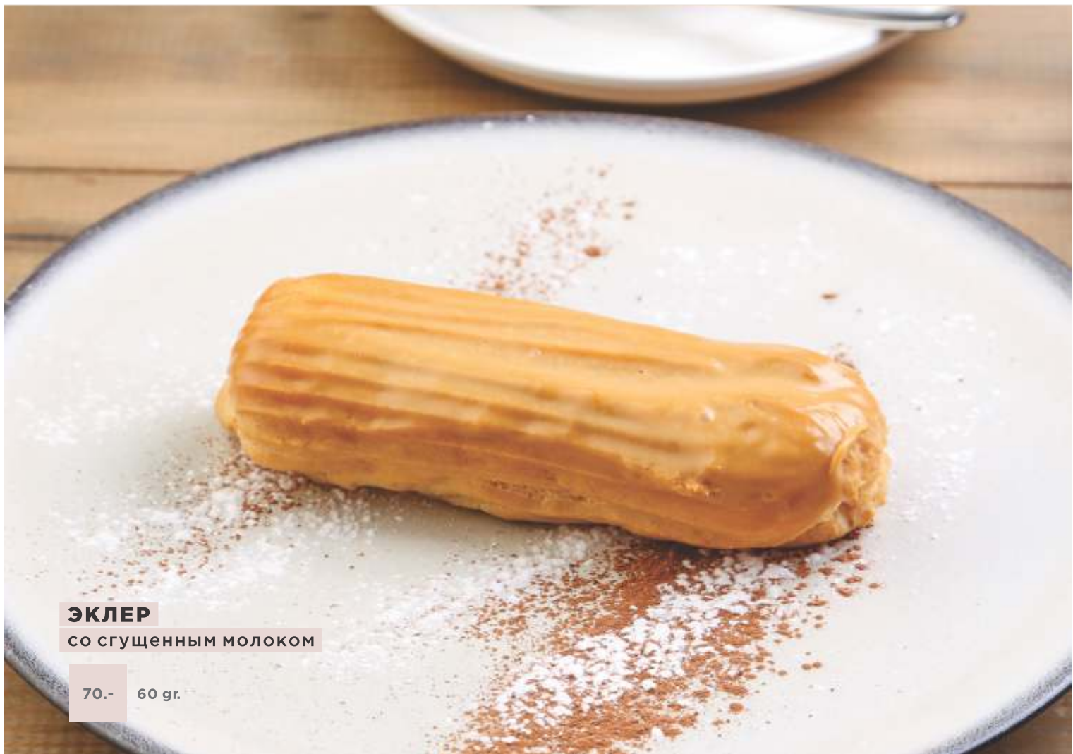
ЭКЛЕР со сгущенным молоком