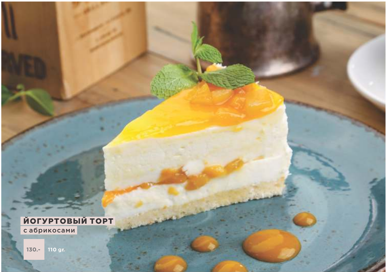
ЙОГУРТОВЫЙ ТОРТ с абрикосами