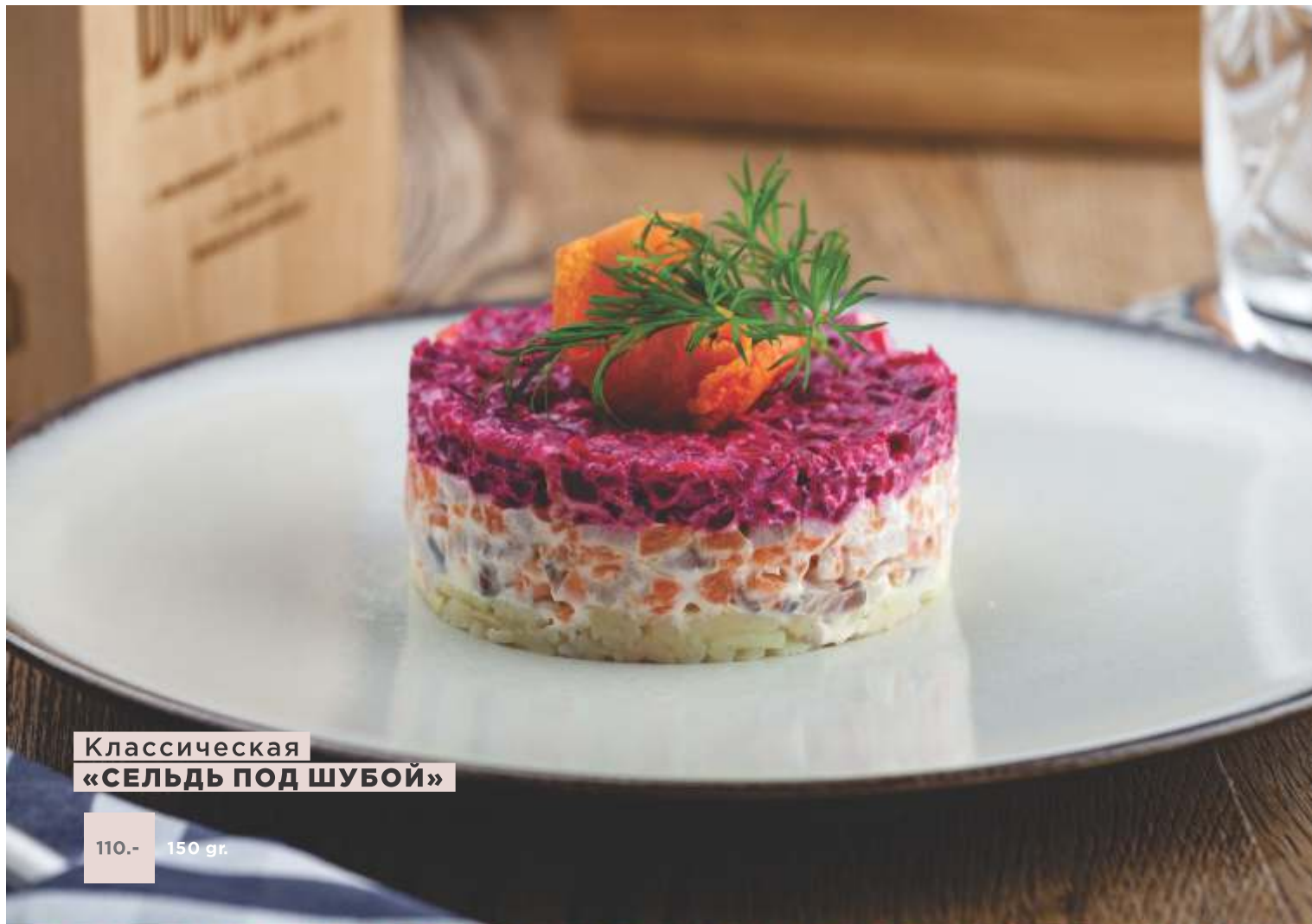
Классическая «СЕЛЬДЬ ПОД ШУБОЙ»