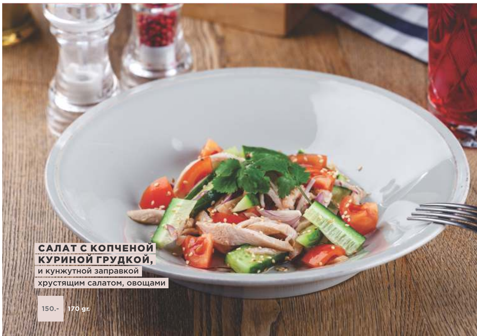
САЛАТ С КОПЧЕНОЙ КУРИНОЙ ГРУДКОЙ, и кунжутной заправкой хрустящим салатом, овощами