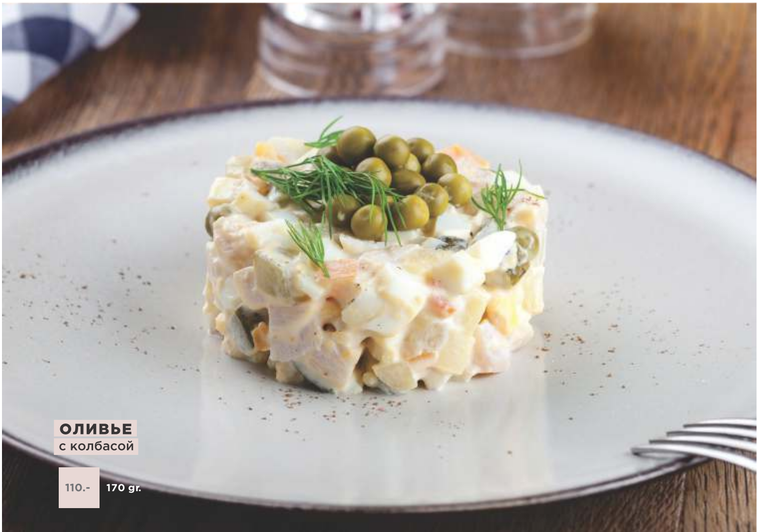
ОЛИВЬЕ с колбасой