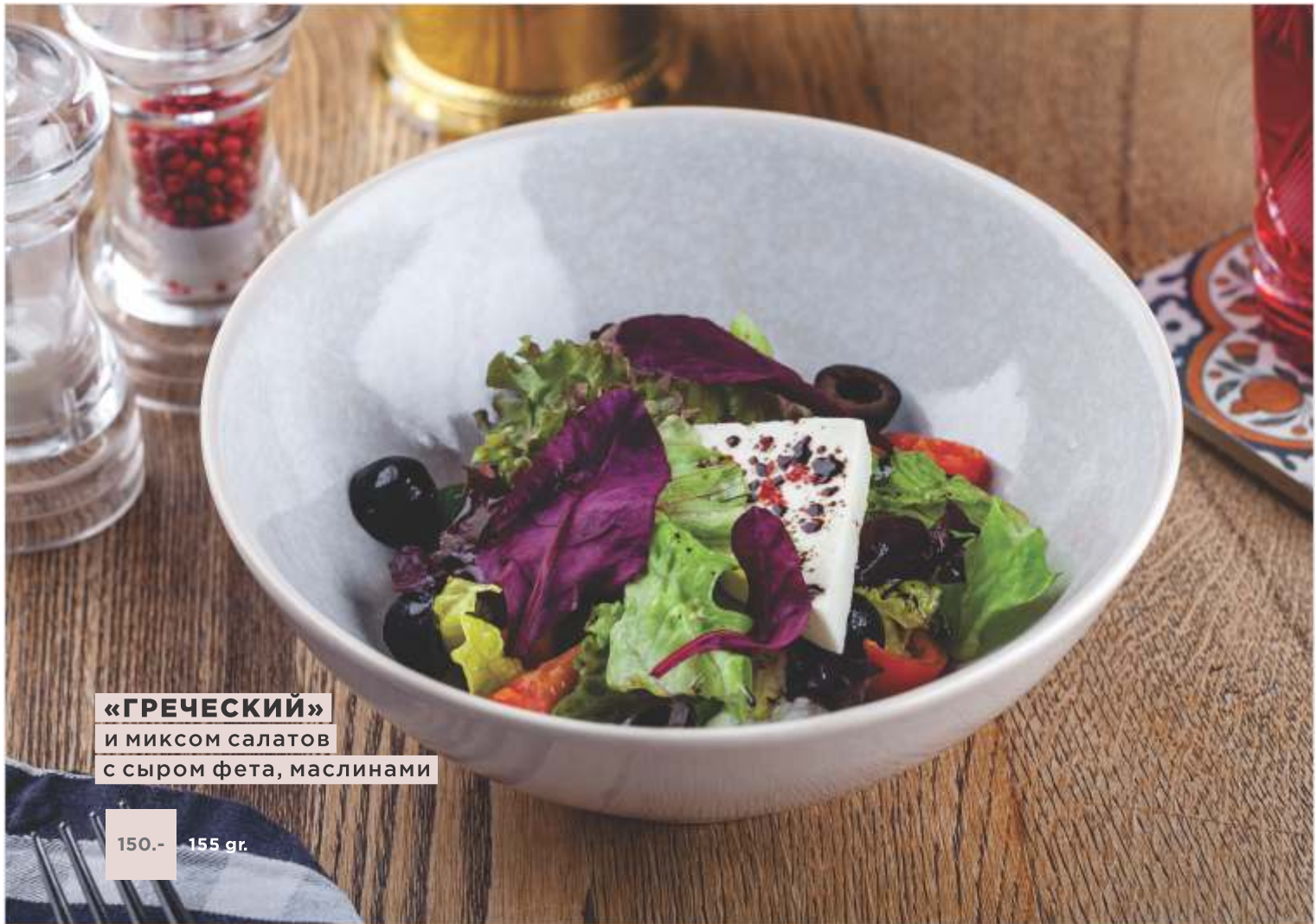
«ГРЕЧЕСКИЙ» и миксом салатов с сыром фета, маслинами