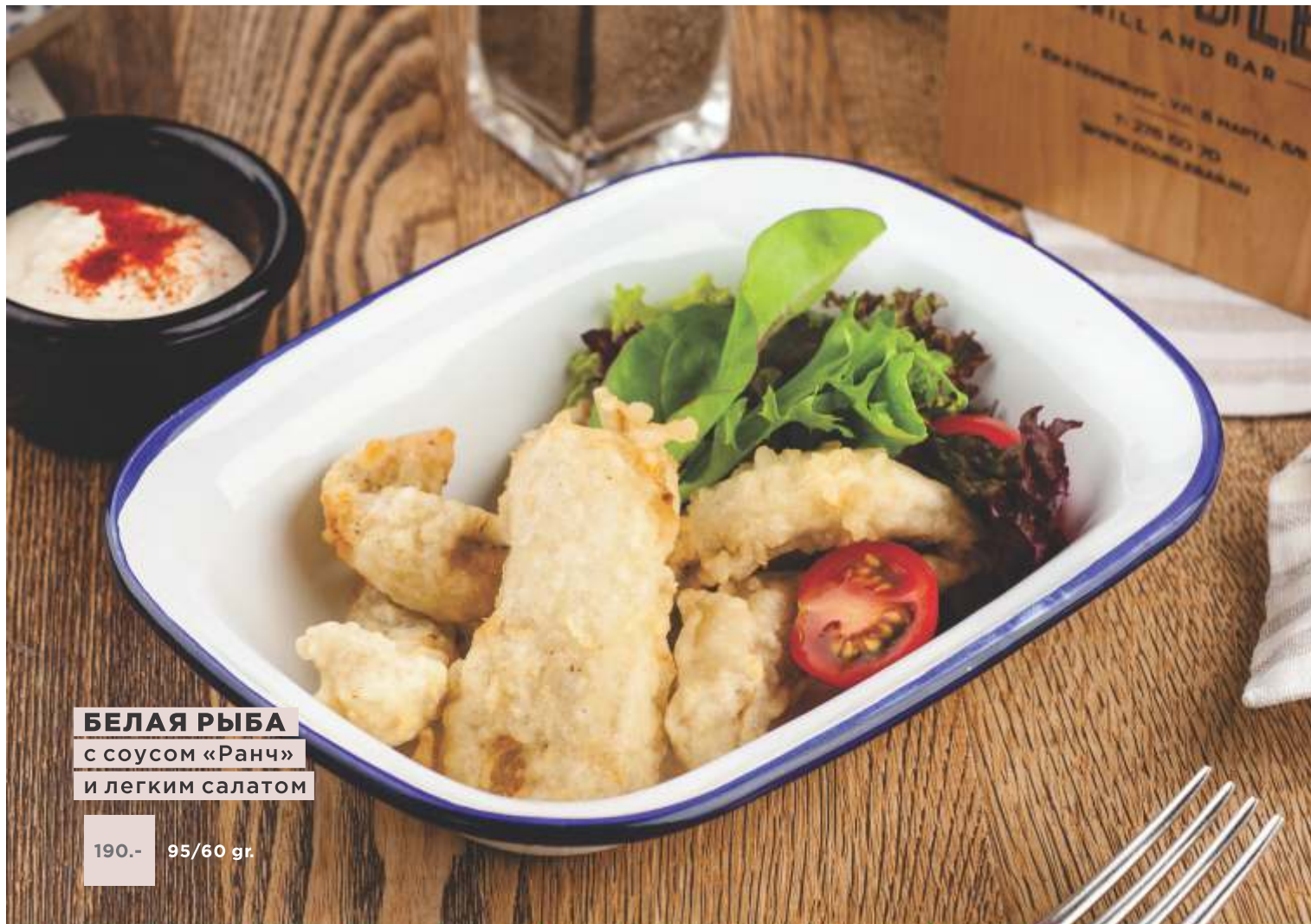
БЕЛАЯ РЫБА с соусом «Ранч» и легким салатом