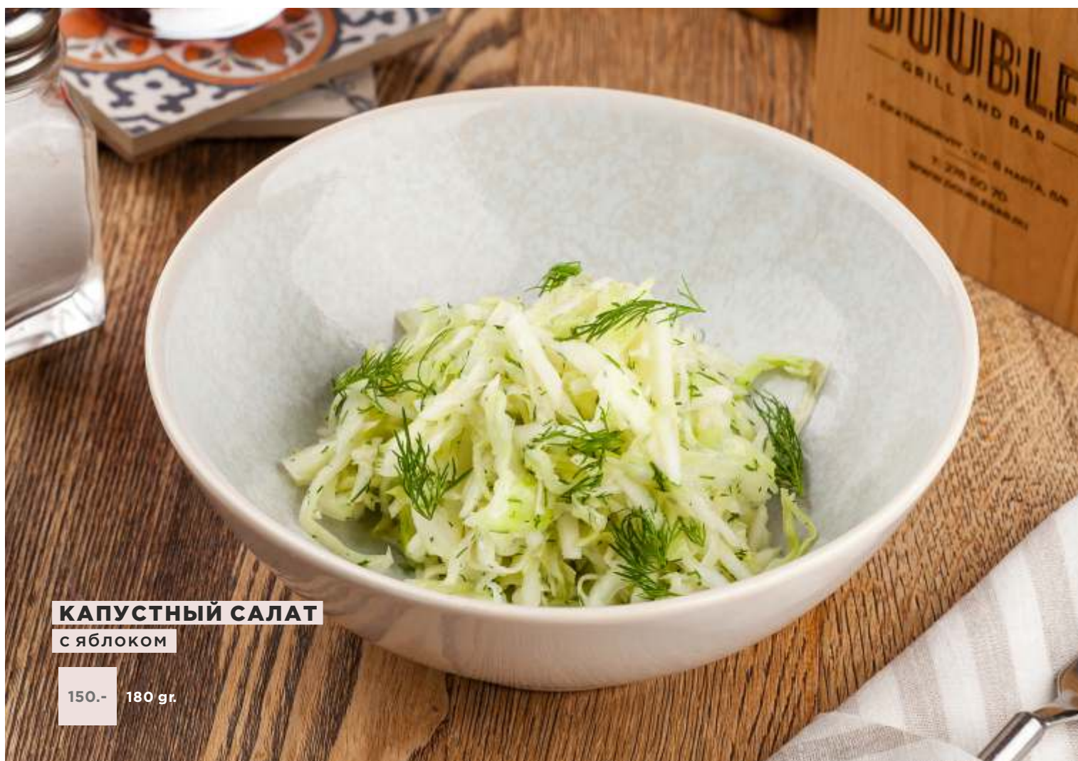
КАПУСТНЫЙ САЛАТ с яблоком