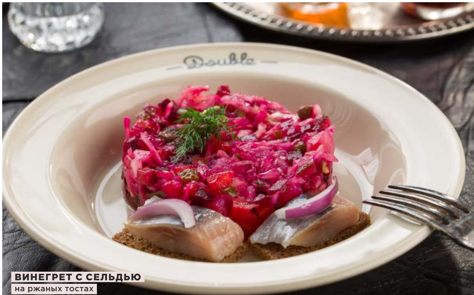
ВИНЕГРЕТ С СЕЛЬДЬЮ на ржаных тостах