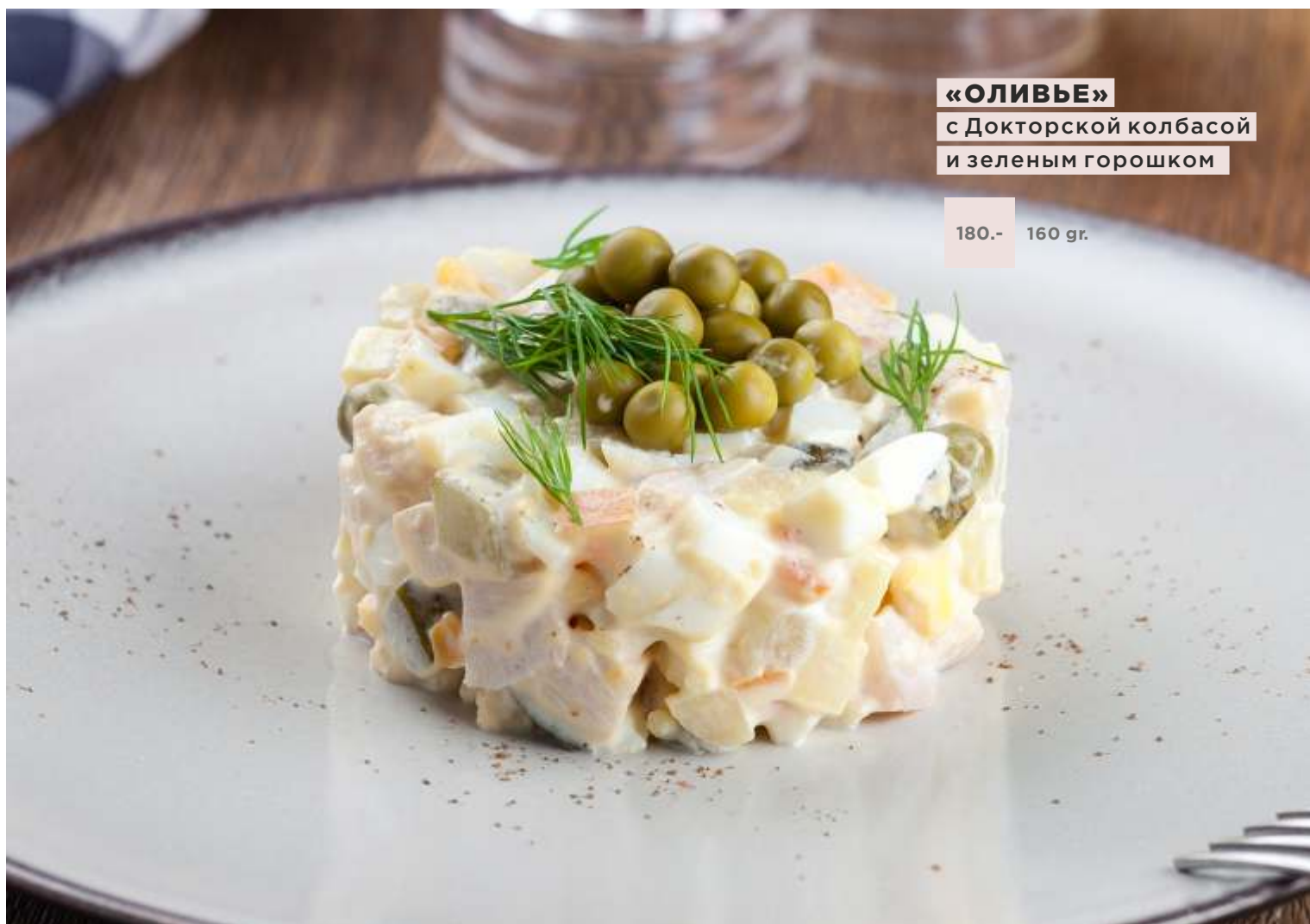
«ОЛИВЬЕ» с Докторской колбасой и зеленым горошком