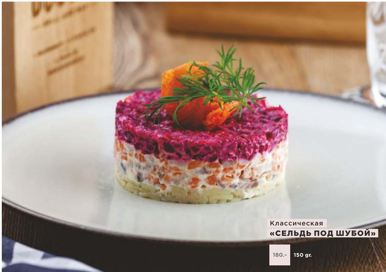
Классическая «СЕЛЬДЬ ПОД ШУБОЙ»