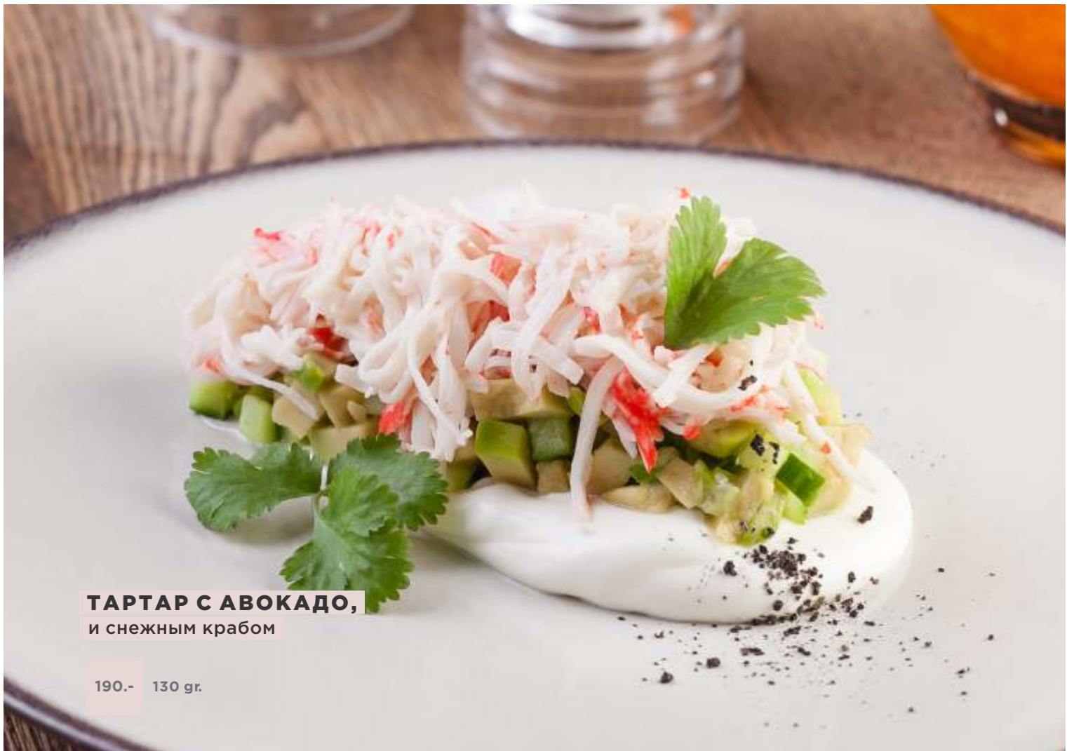
ТАРТАР С АВОКАДО, и снежным крабом