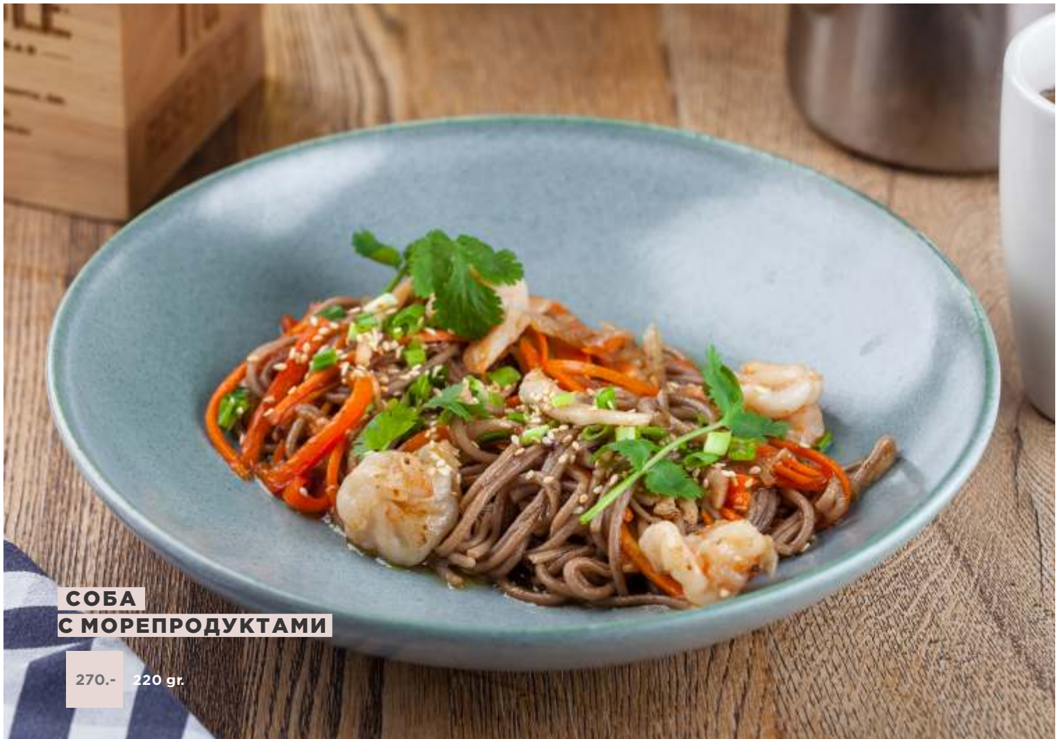
СОБА С МОРЕПРОДУКТАМИ