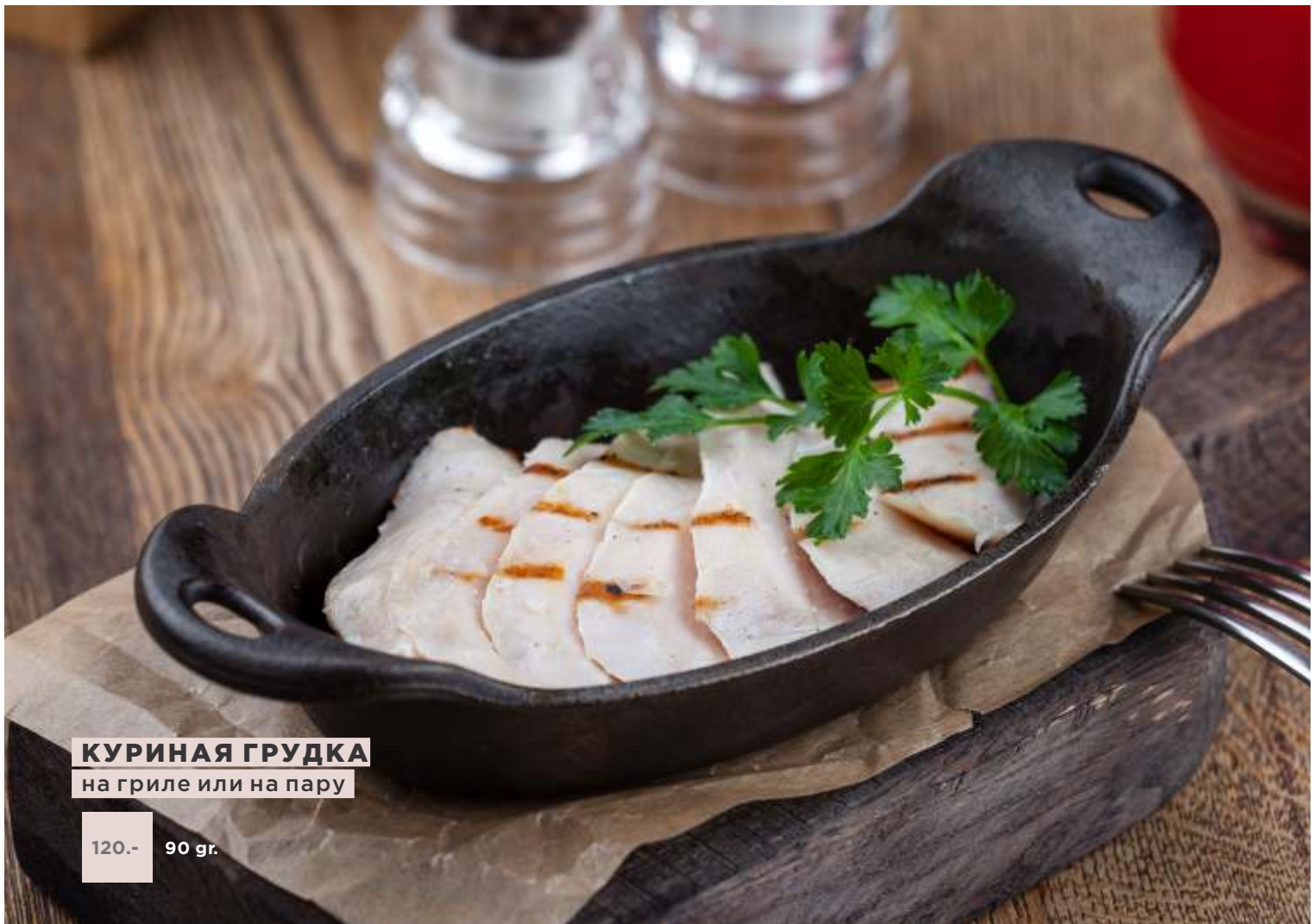
КУРИНАЯ ГРУДКА на гриле или на пару