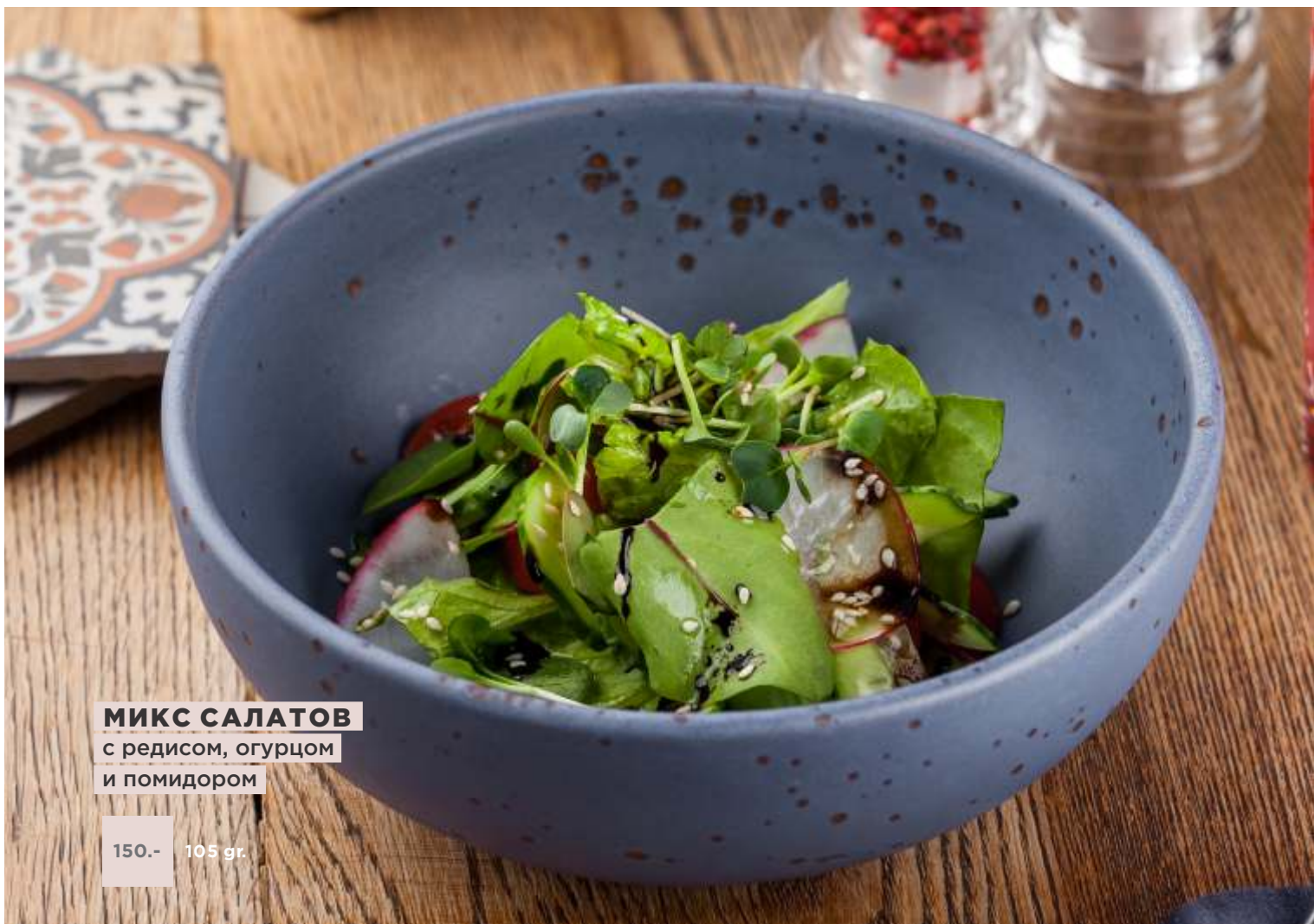
МИКС САЛАТОВ с редисом, огурцом и помидором