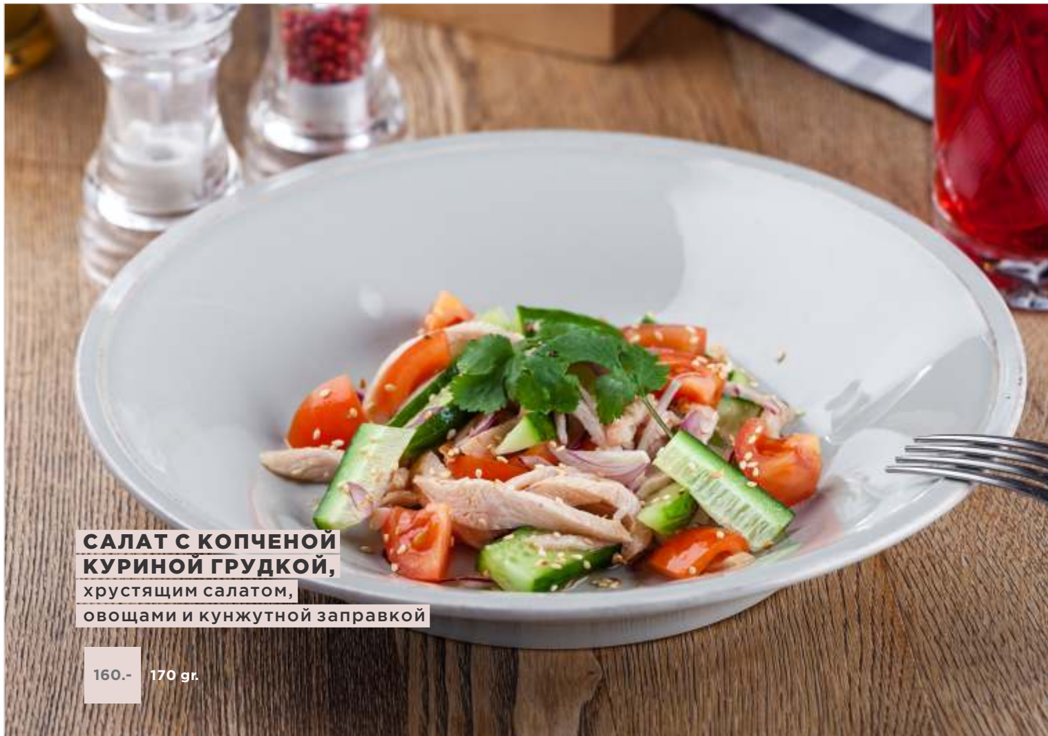
САЛАТ С КОПЧЕНОЙ КУРИНОЙ ГРУДКОЙ, хрустящим салатом, овощами и кунжутной заправкой